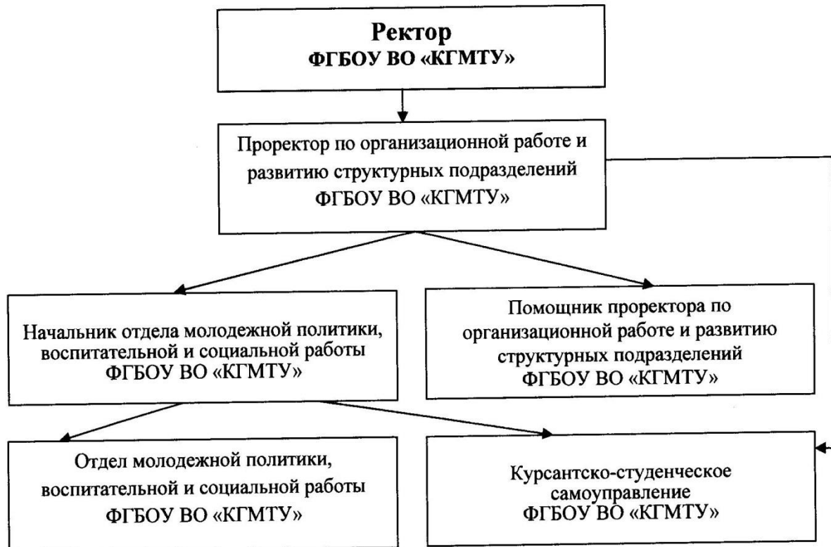
Схема подчиненности отдела молодежной политики, воспитательной и социальной работы.